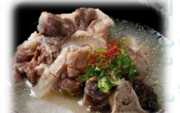
テールスープ 1,000円 (税込1,100円)