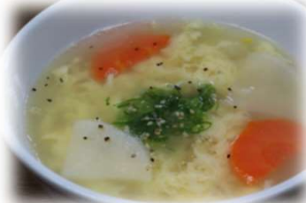
たまごスープ 360円 (税込396円)