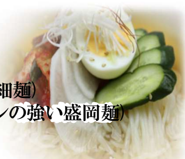
冷麺 (白麺・黒麺) 各880円 (税込968円)