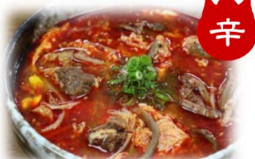
辛 カルビスープ 880円 (税込968円)