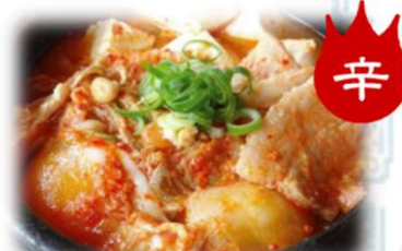
辛 豆腐チゲ 800円 (税込880円)