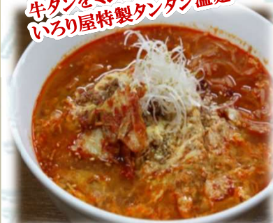
タンタン温麺 880円 (税込968円)