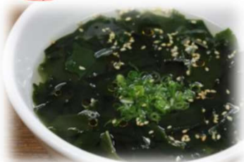
ワカメスープ 350円 (税込385円)