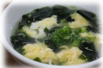
ワカメたまごスープ 430円 (税込473円)