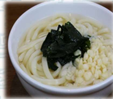
うどん 350円 (税込385円)